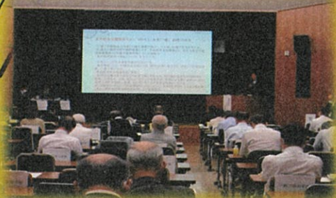
ワークショップひょうご2022

主催 独立行政法人 高齢・障害・求職者雇用支援機構 兵庫支部 共催 兵庫労働局・ハローワーク / 兵庫県 後援 神戸新聞社