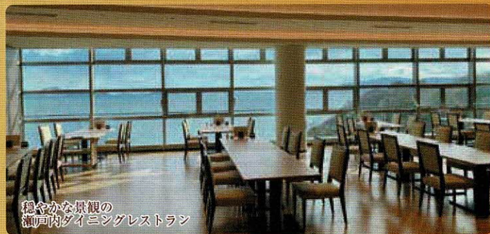
穏やかな景観の 瀬戸内ダイニングレストラン