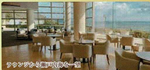
ラウンジから瀬戸内海を一望