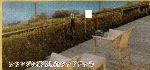
ラウンジに併設したウッドデッキ