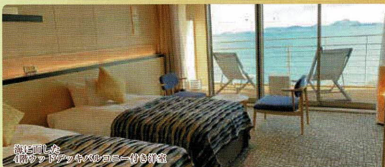
海に面した 4階ウッドデッキバルコニー付き洋室