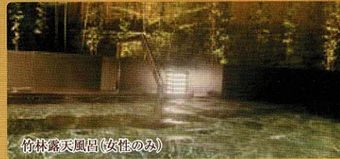
竹林露天風呂(女性のみ)