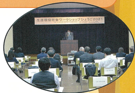
昨年の風景(コロナ対策のため来場者の間隔を確保して開催)